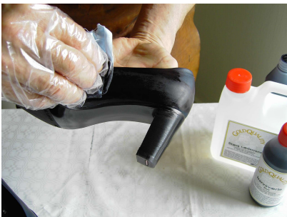
3. Narvsværten arbejdes ind i læderet.