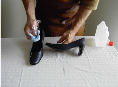
1. Læderskoen renses først med Gold Quality Stærk Rens.

Billedserie viser korrekt indfarvning af lædersko med brug af Gold Quality Narvsværte - Samme metode anvendes ved indfarvning af lædermøbler