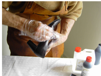
4. Kluden gøres hele tiden våd og gnides hen over læderet flere gange til læderet er jævnt indfarvet.