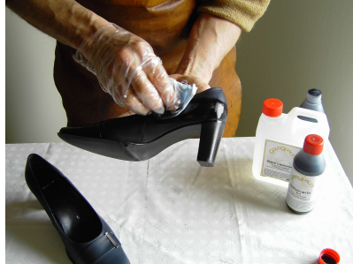
2. Gold Quality Narvsværte påføres med blød klud.