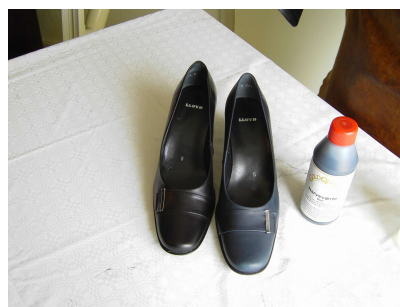
6. Den ene blå lædersko er nu indfarvet sort. Lad tørre ca. 12 timer. Herefter anvendes en læder finish spray for at undgå afsmitning. Efter ca. en uge plejes læderet med et tyndt lag Gold Quality Læderfedt.