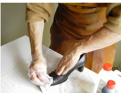
5. Det stadige fugtige læder blankes grundigt af med let hånd, med en blød klud.